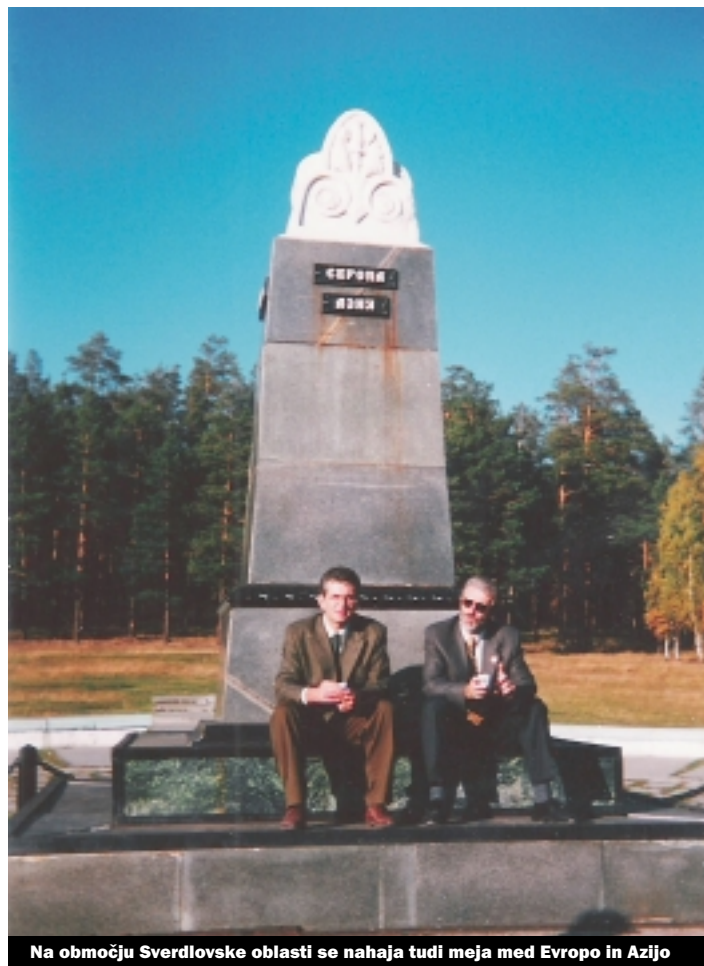
Na območju Sverdlovske oblasti se nahaja tudi meja med Evropo in Azijo