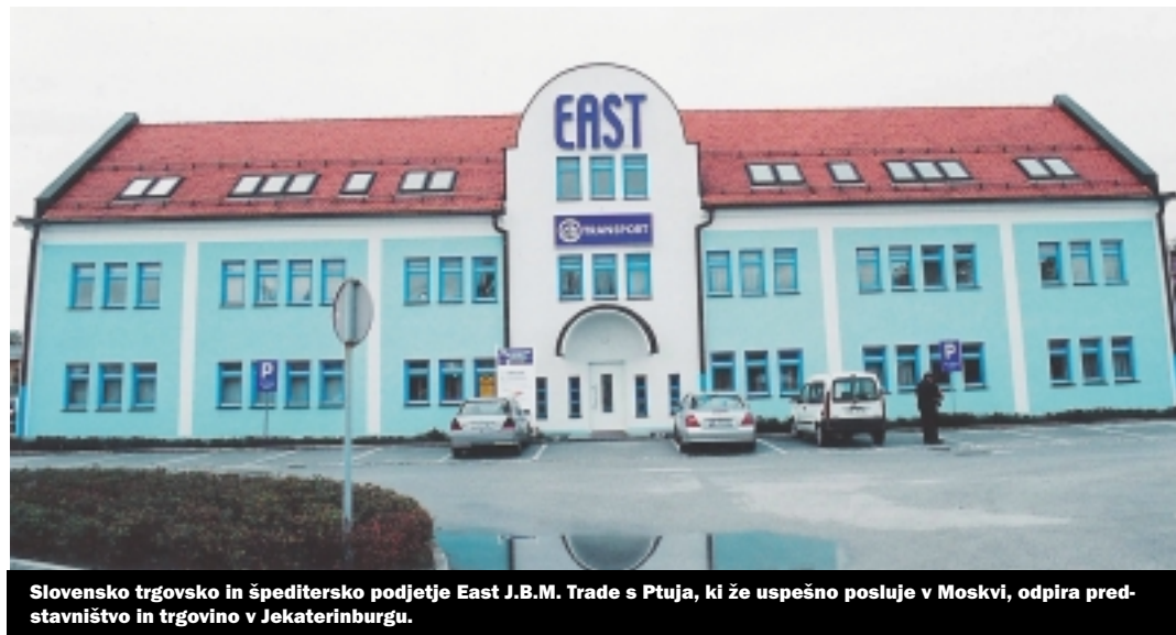
Slovensko trgovsko in špeditersko podjetje East J.B.M. Trade s Ptuja, ki že uspešno posluje v Moskvi, odpira predstavništvo in trgovino v Jekaterinburgu.

Pri strategiji spreminjanja mesta in odpravljanja posledic več deset letnega soc-realističnega razvoja so za vzor vzeli angleško mesto Birmingham. Podžupan je izrazil tudi interes za tesnejše povezovanje z enim od slovenskih mest in je kar sam predlagal Kranj, glede na to, da sta v Ekaterinburgu dve slovenski podjetji Iskratel in Iskraemeco iz Kranja.